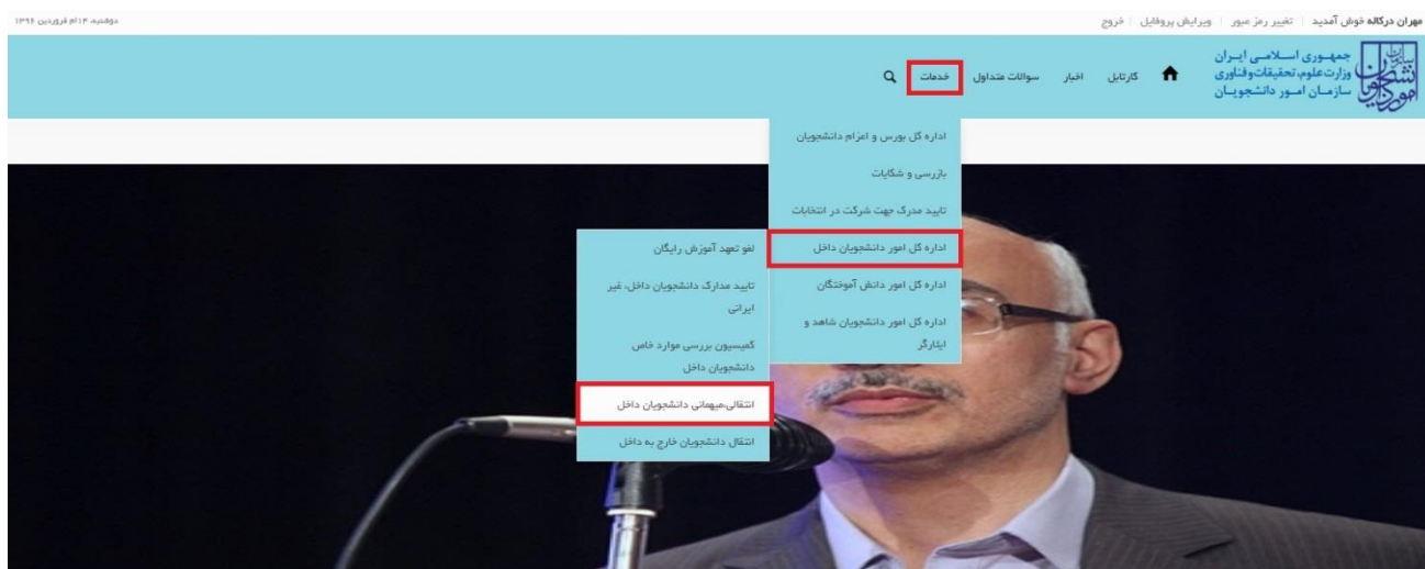
تصویر ۱-نمایش پورتال

توجه بفرمایید که متقاضی برای مشاهده این درخواست در منوی خدمات، باید حداقل یک مقطع تحصیلی کاردانی یا کارشناسی داخل کشور با وضعیت تحصیلی شاغل به تحصیل یا مرخصی تحصیلی (نوع دانشگاه غیر از پیام نور و جامع علمی کاربردی) یا یک مقطع تحصیلی داخل کشور دکتری حرفه ای در رشته دامپزشکی با وضعیت تحصیلی شاغل به تحصیل یا مرخصی تحصیلی در پروفایل ثبت نام خود داشته باشد. در صورت عدم مشاهده این درخواست، پروفایل خود را از طریق گزینه ویرایش پروفایل، اصلاح نمایید و سپس از منوی خدمات به ثبت درخواست مربوطه بپردازید.