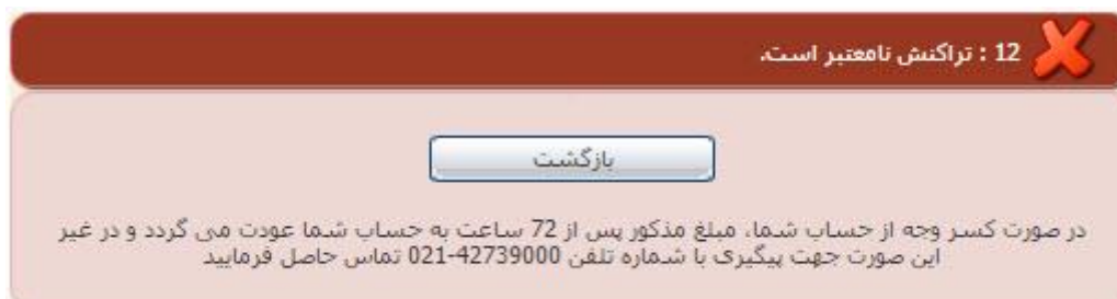
تصویر ۸-نمایش اخطار تراکنش ناموفق

با دریافت پیغام جهت مراجعه به پورتال، برای مشاهده وضعیت خود اقدام نمایید. از طریق پورتال سازمان امور دانشجویان سربرگ کارتابل را انتخاب نمایید.(تصویر 9)